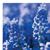
Muscari (jacinthe en grappes)